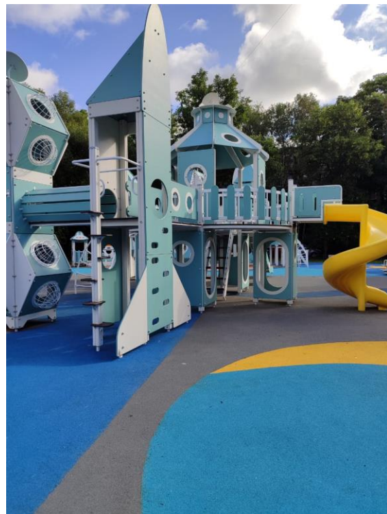
Замена оборудования по пр. Народного Ополчения, д. 165