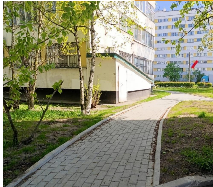
Устройство пешеходных дорожек по ул. Генерала Симоняка, д. 23 и другим адресам.