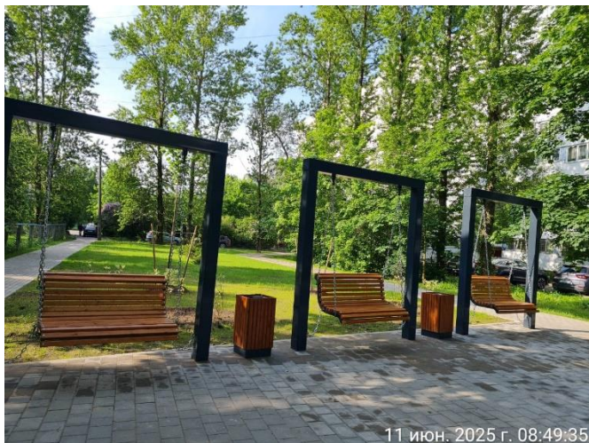
Комплексное благоустройство по адресу пр. Ветеранов, д. 104

В рамках регионального проекта «Формирования комфортной городской среды» выполнено комплексное благоустройство территорий. Стоимость реализации проектов составила 35,6 млн рублей, из которых 32,4 млн рублей выделены Правительством Санкт-Петербурга в рамках программы «Петербургские дворы».